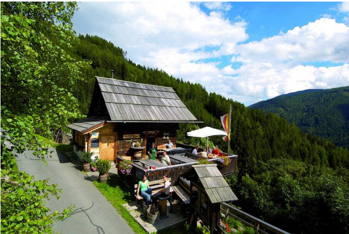
Buschenschank Matl Sepp